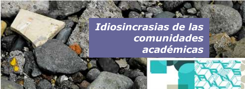
Idiosincrasias de las comunidades académicas