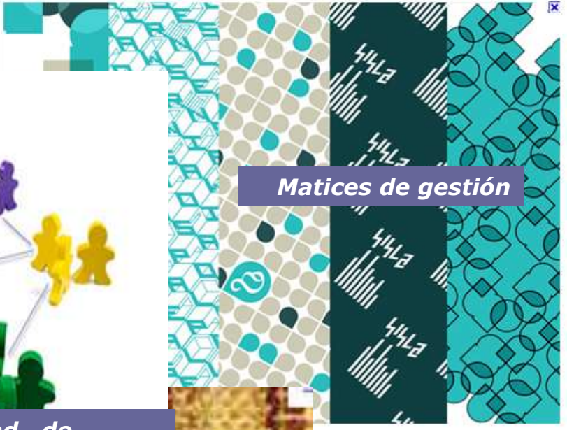
Matices de gestión