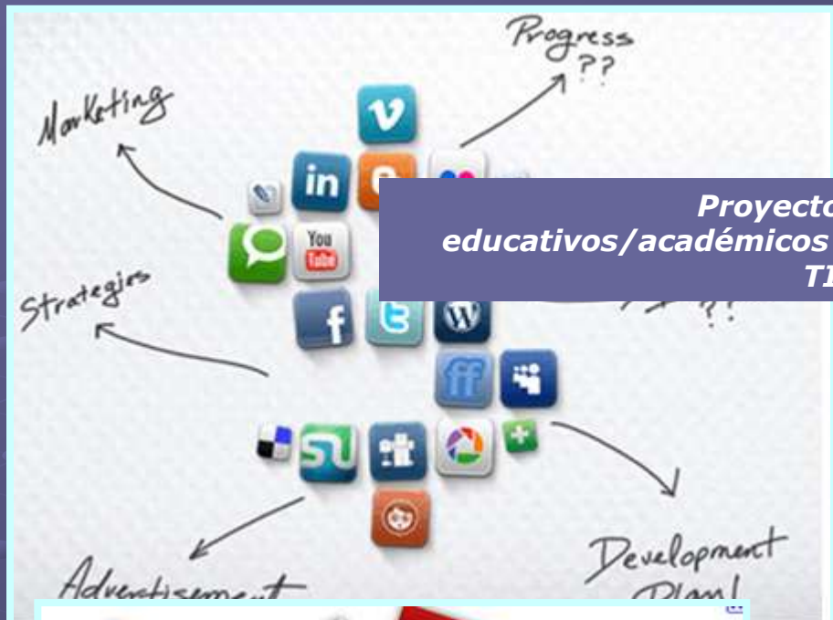
Proyectos educativos/académicos y TIC