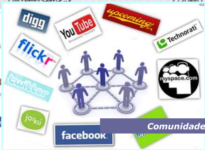
Comunidades y TIC