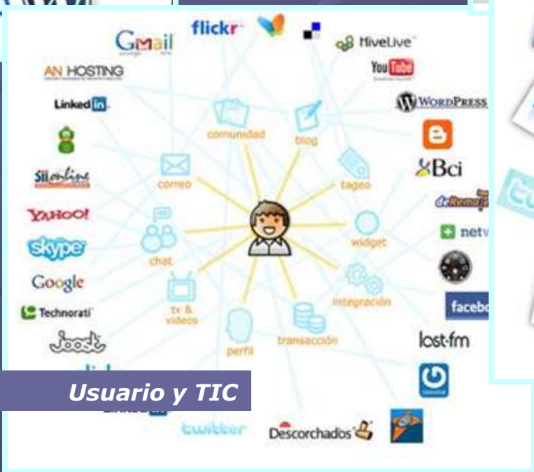
Usuario y TIC