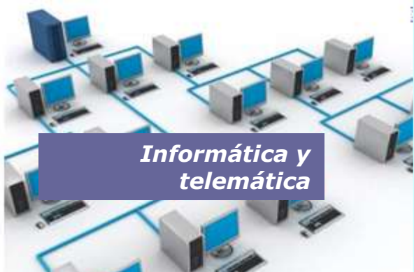
Informática y telemática