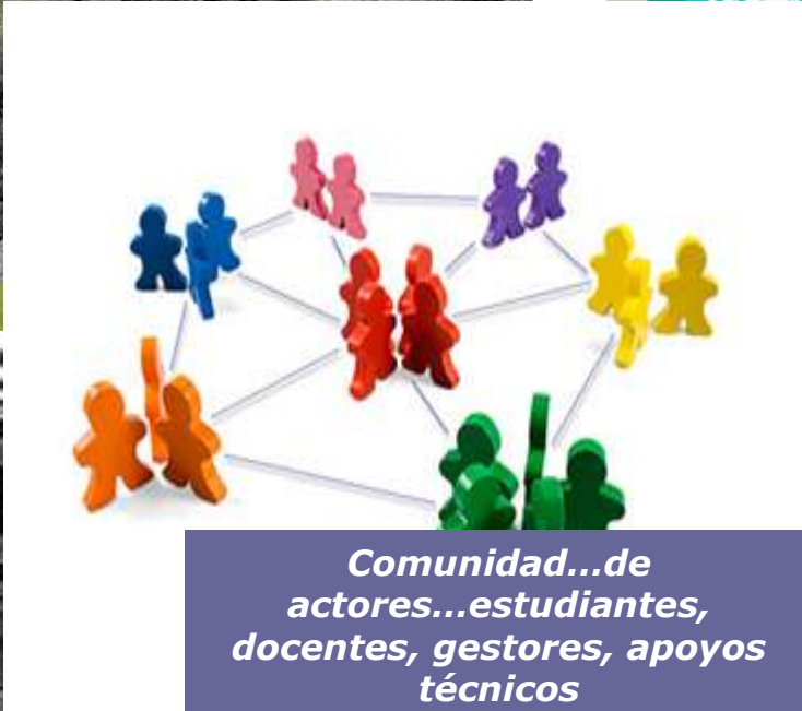
Comunidad...de actores...estudiantes, docentes, gestores, apoyos técnicos